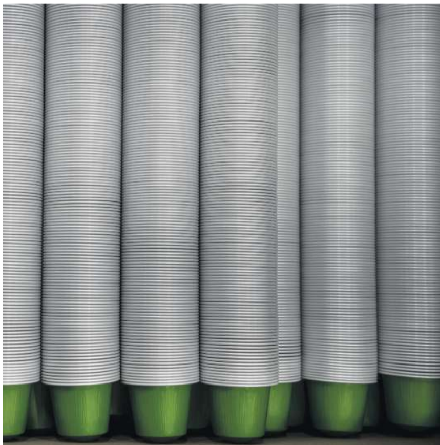
Es werden immer mehr: Dätwyler investiert Millionen in Anlagen, um für den Kaffeeanbieter Nespresso zusätzliche Aluminiumkapseln herzustellen.

Ein Blick lässt sich hingegen auf die Anlagen werfen, die sich in einer Halle direkt neben den Automaten für die Kapselherstellung befinden und für die Fertigung der Dichtung verwendet werden. Auch in diesem Bereich stehen in grosser Zahl Staubli-Roboter im Einsatz, welche die Produktionslinien mit den Kapseln be- und entladen. Herzstück dieser Anlagen ist jedoch ein Ofen, in dem das zuvor flüssig aufgetragene Silikon, das der Dichtung dient, wärmebehandelt und verfestigt wird.